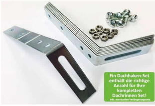
Ein Dachhaken-Set enthält die richtige Anzahl für Ihre kompletten Dachrinnen Set! mit elektrischer Verschraubung