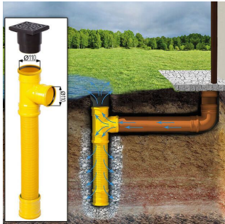
Sickerschacht mit Zufluss/Abfluss Ø 110 mm