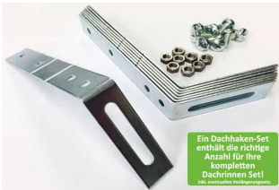
Dachhaken Set für PVC | Satteldach