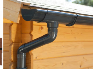
PVC Dachrinnen für Satteldach bis 8,75 m