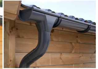
Dachrinnenset Zink für Satteldach bis 6,8 m