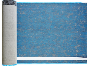
Villasub E-KV-15 SK Schalungsbahn 40 m 2