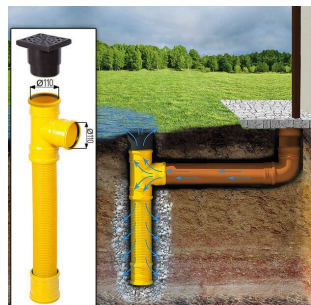
Sickerschacht mit Zufluss/Abfluss Ø 110 mm