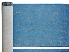
Villasub E-KV-15 SK Schalungsbahn 20 m 2