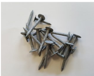
Dachpappennägel (Breitkopfst.) 25/25 verzinkt