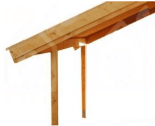
Vordach - 300 x 150 cm