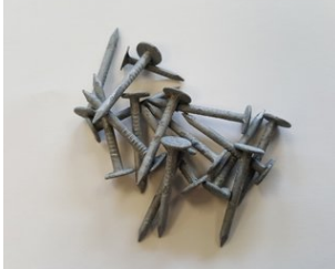
Dachpappennägel (Breitkopfst.) 25/25 verzinkt