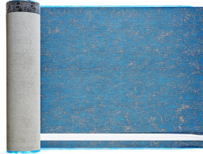
Villasub E-KV-15 SK Schalungsbahn 20 m 2