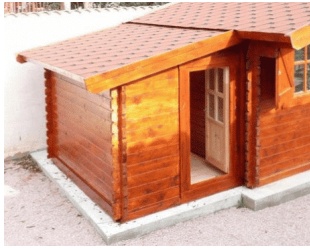
Anbau Werkzeugschuppen - 161 x 273 cm