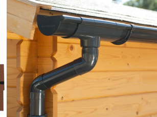
PVC Dachrinnen für Satteldach bis 10,5 m