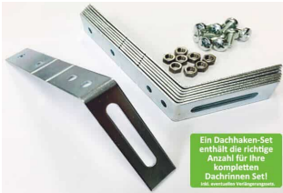
Dachhaken Set für PVC | Satteldach