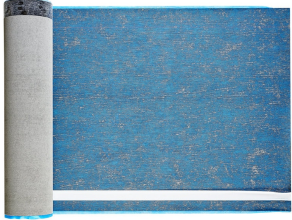
Villasub E-KV-15 SK Schalungsbahn 200 m 2