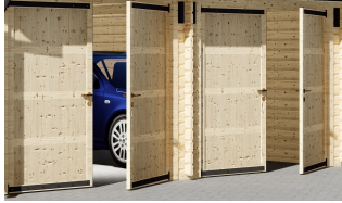
Garagentor - Doppelflügeltür aus Holz